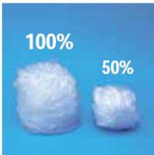
50 % d'économie de film