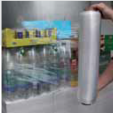
Film sur mandrin