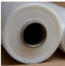
Mimalite Thin Core « Mandrin léger »